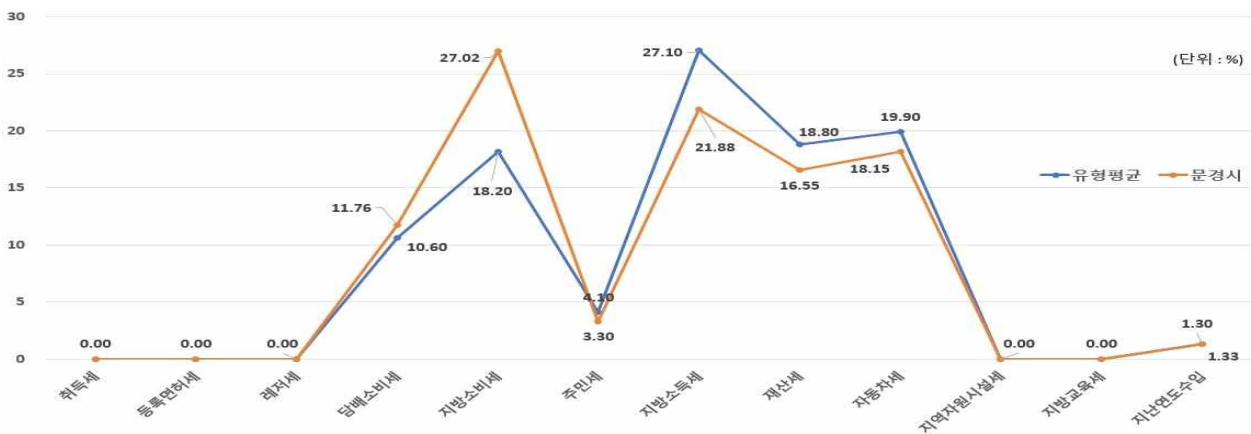
유형 지방자치단체와 지방세징수액 세목별 비중비교

우리시의 '23년도 지방세 비중은 지방소비세(27.02%), 지방소득세(21.88%), 자동차세(18.15%) 등등 순입니다. 특히 주민세 징수액이 '22년 대비 24% 증가 하였습니다.